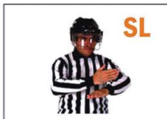
SLASHING (ATAQUE CON EL STICK)