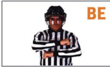
BUTT-ENDING (GOLPEAR CON EL EXTREMO DEL STICK)