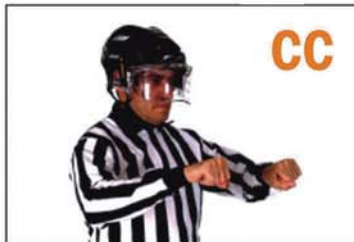
CROSS-CHECKING (ATAQUE CRUZADO CON EL STICK)