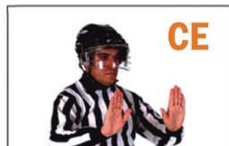
CARGA POR LA ESPALDA