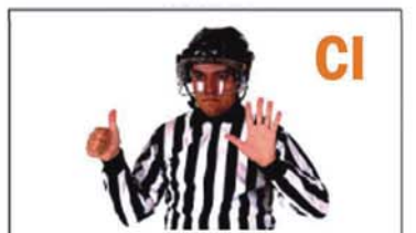
DEMASIADOS JUGADORES EN PISTA-CAMBIO ILEGAL