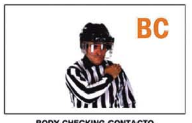
BODY-CHECKING-CONTACTO INTENCIONADO CON EL CUERPO