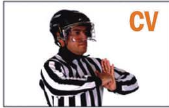
BOARDING (CARGA CONTRA LA VALLA)