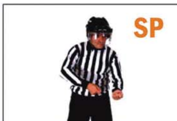
SPEARING (PUNZAR CON EL STICK)